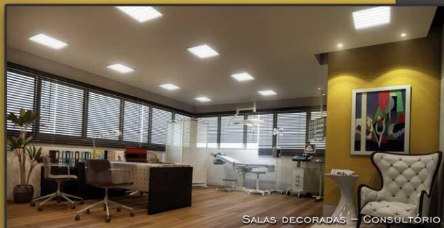
SALAS DECORADAS - CONSULTÓRIO