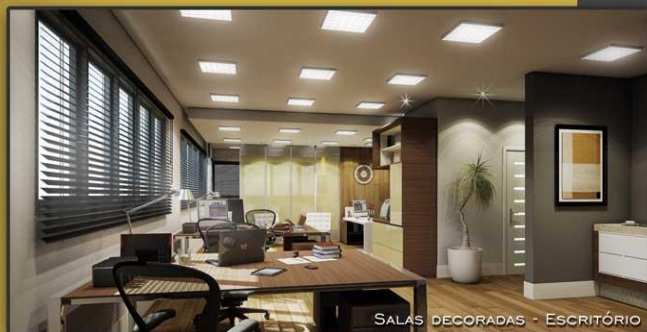
SALAS DECORADAS - ESCRITÓRIO

DESFRUTE DE QUALIDADE DE VIDA NO SEU TRABALHO